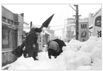
電線をくぐって通る市民 38 豪雪写真 広報 50203

小学校には除雪のため自衛隊が寝泊りしていた。我々はバス通学のため早めに学校に着いたが、寝ている隊員達の間を走り回り、上を飛び越えて遊んだ。隊員は重労働の後、底冷えする体育館で寝袋一つで寝ていたのだが、一回も怒られたことはなかった。今思えば大変申し訳ないことをしたと思うが、当時は楽しくてたまらなかった。