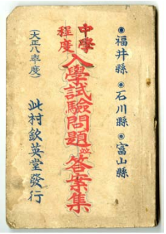
『中学程度入学試験問題並答案集』 (坪田仁兵衛家文書(C0005) 整理中)